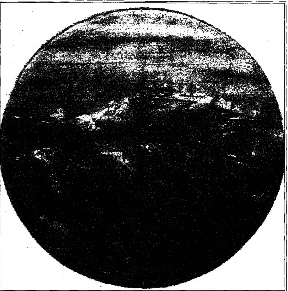
عملان لرافع الناصري